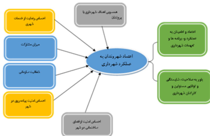
شکل (۱). مدل مفهومی تحقیق مبنی بر عوامل مؤثر بر میزان اعتماد شهروندان به عملکرد شهرداری ساری

این تحقیق، با ترکیب نظریه‌های گیدنز، زتومکا، پاتنام، فوکویاما و پیشینه تجربی تحقیق، عوامل مؤثر بر میزان اعتماد شهروندان به عملکرد شهرداری ساری بر اساس شش مؤلفه همسویی اهداف شهرداری با نیازهای شهروندان، احساس رضایت از خدمات شهری، میزان مشارکت، شفافیت سازمانی، احساس امنیت پیاده‌روی در شهر و احساس امنیت از فضای ساختمانی در شهر بررسی شده است. این شش مؤلفه به صورت مدل تحلیلی در شکل (۱) نشان داده شده‌اند.