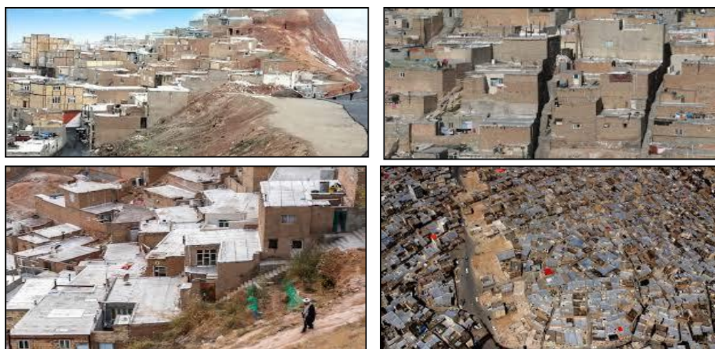
شکل (۲). تصاویری از سکونتگاه‌های غیررسمی شهر تبریز