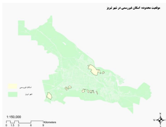
شکل (۱). موقعیت سکونتگاه‌های غیررسمی در شهر تبریز.

رواسان و آخماقیه حاشیه‌نشین محسوب می‌شوند. به لحاظ شرایط توپوگرافی، این محلات در شیب‌های بسیار تند واقع شده‌اند و بسیاری از آن‌ها دسترسی سواره ندارند و رفت‌وآمد از طریق پلکان انجام می‌گیرد. نداشتن سیستم فاضلاب و تأسیسات استاندارد از دیگر ویژگی‌های این محلات است. کیفیت مسکن این محلات بسیار پایین و حتی گاه‌با مصالحی چون خشت و گل می‌باشد. بافت متراکم و غالب مسکونی که بدون هیچ‌گونه فضای باز و سبز می‌باشد در این مناطق به چشم می‌خورد (شکل ۲).