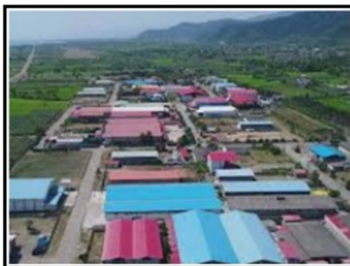
شکل (۳). چشم انداز شهرک صنعتی تالش

در این بعد، شهرک صنعتی تنها در دو معیار منظر و زیبایی، و پوشش سبز تأثیرات مثبت کم (نزدیک به متوسط) داشته و در شش معیار دیگر دارای تأثیرات منفی بوده است. به لحاظ پوشش سبز، با احداث شهرک صنعتی، بخشی از زمین های بایر به ساختمان و معبر و بخش قابل توجهی به درختکاری اختصاص داده شده است، از این رو تأثیر آن در ایجاد تاج سبز بیشتر در منطقه، مثبت تلقی شده است. فضای سبز مجموعه صنعتی نزدیک به ۱۰ هکتار می باشد (شهیدی، ۱۳۹۷). طراحی مجموعه صنعتی و منظره طرح و چشم انداز بیرونی آن از نگاه نمونه آماری هر چند در طیف کم (نزدیک به متوسط)، مثبت ارزیابی شده است شکل (۳).