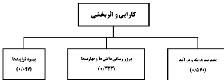
شکل (۹). وزن زیرمعیارها برای معیار کارایی و اثربخشی