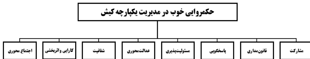
شکل (۲). معیارهای نشانگر حکمروایی خوب در مدیریت یکپارچه کیش

در این بررسی، برای سنجش حکمروایی خوب در مدیریت یکپارچه نواحی ساحلی، هشت معیار مشارکت، قانون‌مداری، پاسخگویی، مسئولیت‌پذیری، عدالت‌محوری، شفافیت، کارایی و اثربخشی و اجتماع‌محوری و بیست و پنج زیرمعیار در محدوده مطالعاتی ارزیابی می‌شود. شکل (۲) معیارهای نشانگر حکمروایی خوب در مدیریت یکپارچه کیش را نشان می‌دهد.