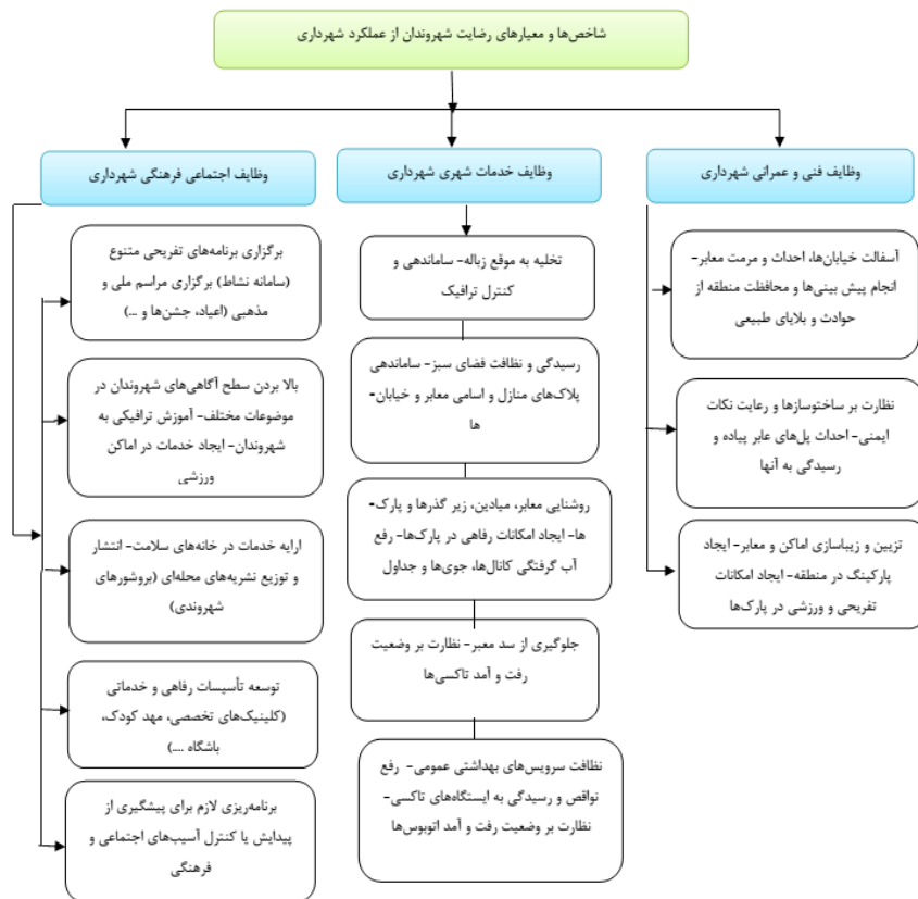
شکل (۳). مدل عملیاتی تحقیق محدودی مورد مطالعه