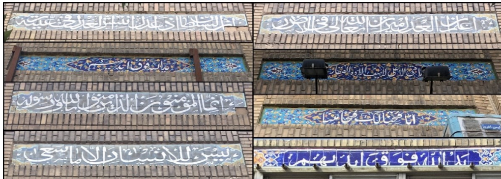
شکل (۴). نمونه‌هایی از اذکار استفاده شده در جداره خیابان امام رضا (ع)

جداره‌های خیابان امام رضا(ع) دو دسته نوشته بر روی خود دارند. یکی ذکرهایی است که با کاشی‌کاری بر روی جداره خیابان نقش بسته‌اند و دیگری نام بازارها، پاساژها و واحدهای تجاری است. همه این‌ها با ظاهری هماهنگ و هم‌خوان با یکدیگر شکل گرفته‌اند که هم فرهنگ ایرانی و هم آموزه‌های اسلامی را به نحو مطلوبی به نمایش می‌گذارند. در شکل (۵) نمونه‌ای از کاشی‌کاری‌های از این دست ملاحظه می‌گردد.