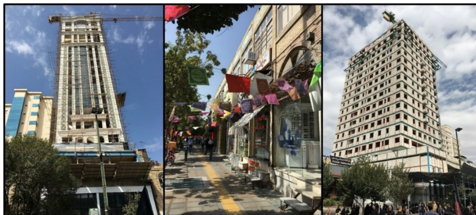
شکل (۳). جداره قدیمی و جداره جدید خیابان امام رضا (ع)

پس نباید هویت یک شهر و یا کشور را برای کسب ارزش افزوده و سود عده‌ای قلیل برای سال‌های متمادی، نامتقارن و ناهماهنگ با حرم مطهر و فرهنگ ایرانی نمود. خیابان امام رضا(ع) در اتصال با حرم مطهر است و تنها سه خیابان دیگر (شیرازی، طبرسی و نواب صفوی) با این نقش وجود دارند. البته عرض خیابان امام رضا(ع) در وضعیت کنونی از سه خیابان مذکور بیشتر است. با مقایسه گذشته و امروز خیابان امام رضا(ع) تفاوت جداره‌ها به وضوح مشخص می‌شود. امروز به جای آنکه مردم شاهد توجه مدیران شهری به چنین نمونه‌هایی و حفاظت و حراست از آن‌ها و نیز تکرار آن سیاست‌ها در دیگر نقاط شهر باشند، شاهد از بین رفتن این آثار و به وجود آمدن ساختمان‌های مرتفع در نزدیکی حرم مطهر هستند. بدون هیچ‌گونه ضابطه و قانونی و بدون توجه به جداره‌های طراحی شده چهار دهه پیش، هر طور که مالکان و صاحبان املاک مایل باشند، می‌توانند ساخت و ساز و یا مرمت کنند. در شکل (۳) جداره چهار دهه پیش با خط آسمان هماهنگ ملاحظه می‌گردد. اما امروز هتل‌هایی با ارتفاع، ابعاد، اندازه و نمای متفاوت شکل گرفته‌اند و یا در حال شکل‌گیری هستند.