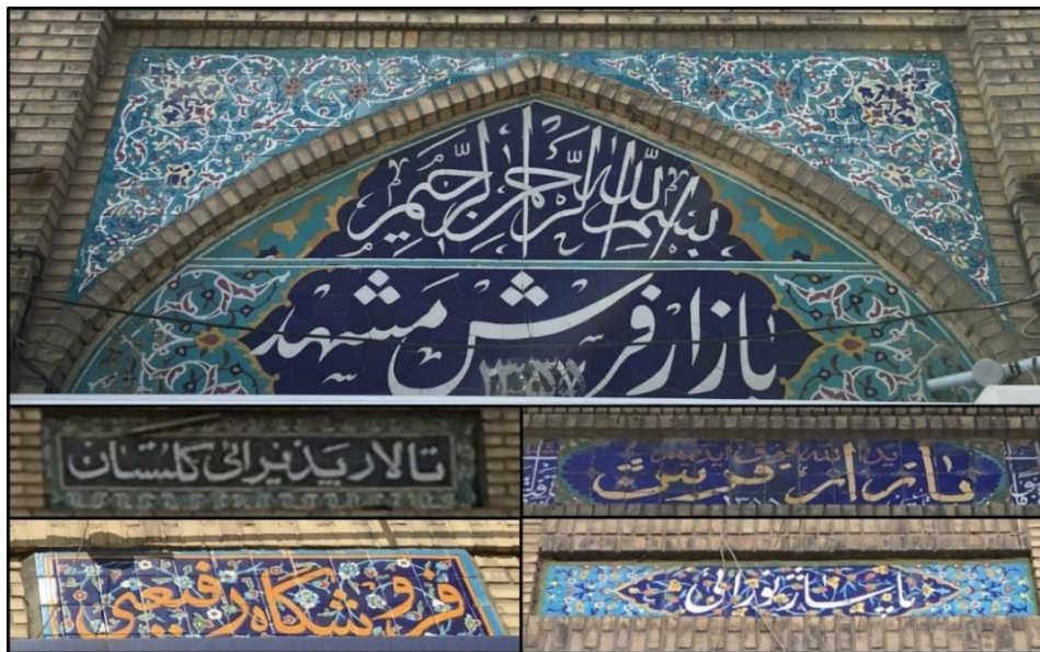
شکل (۵). نمونه‌هایی از تابلوهای استفاده شده در جداره خیابان امام رضا(ع)

جداره‌های خیابان امام رضا(ع) دو دسته نوشته بر روی خود دارند. یکی ذکرهایی است که با کاشی‌کاری بر روی جداره خیابان نقش بسته‌اند و دیگری نام بازارها، پاساژها و واحدهای تجاری است. همه این‌ها با ظاهری هماهنگ و هم‌خوان با یکدیگر شکل گرفته‌اند که هم فرهنگ ایرانی و هم آموزه‌های اسلامی را به نحو مطلوبی به نمایش می‌گذارند. در شکل (۵) نمونه‌ای از کاشی‌کاری‌های از این دست ملاحظه می‌گردد.