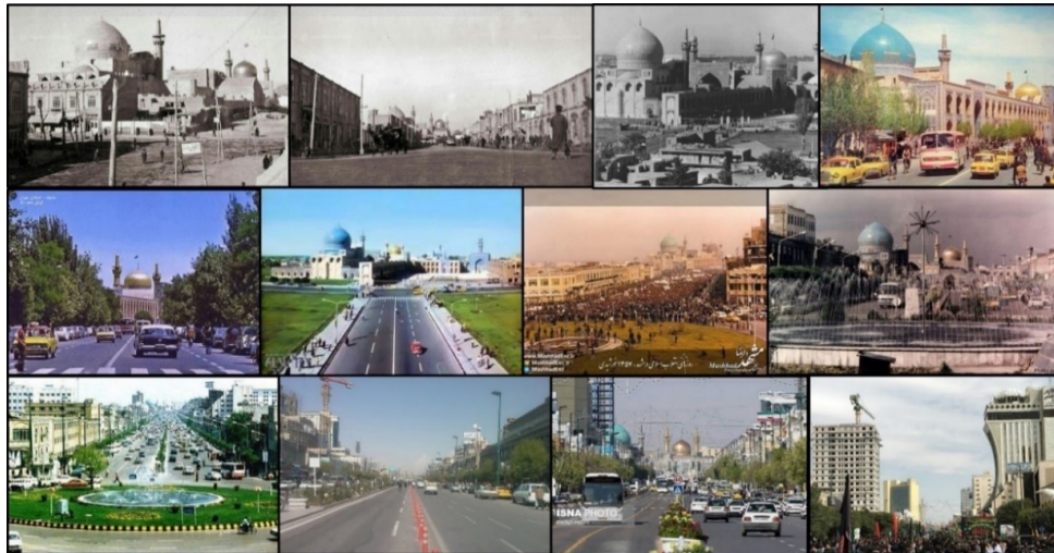
شکل (۲). منظر خیابان امام رضا (ع) در قرن اخیر

تعهد در بین مدیران، مسئولان، برنامه‌ریزان و طراحان شهری موجب این ناهماهنگی و بی‌نظمی در خیابان امام رضا (ع) شده است. در شکل (۲) منظر خیابان امام رضا (ع) در قرن اخیر آورده شده است.