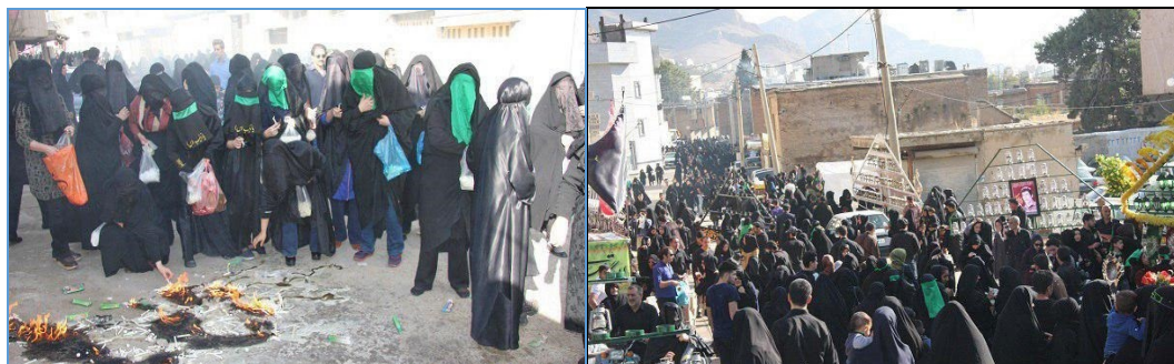
شکل (۱): افراد حاضر در مراسم چهل منبر شهرستان خرم‌آباد روز تاسوعای سال ۱۳۹۷