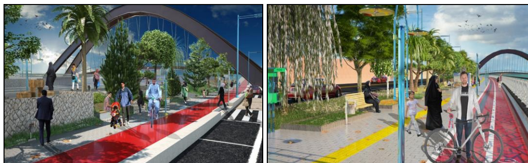
شکل (۸). طراحی سه بعدی فضای پیشنهادی برای ساحل کشکان رود (نگارنده، ۱۳۹۷)

با تاکید ویژه بر محدوده می توان بیان داشت مهم ترین راهبرد برای ایجاد گردشگری شهری رودخانه شهری در این منطقه عبارت است از: تلاش برای ایجاد محیطی اجتماعی و امن با امکانات و سهولت دسترسی و تاکید خاص نسبت به مسائل زیست محیطی و بوم شناختی است. به همین منظور، بر اساس آن چه بیان گشت، معیارهای اصلی طراحی مبتنی بر قابلیت های محلی تعریف می گردد. لازم به ذکر است در زمینه های اجتماعی، تفریحی، تاریخی و زیست محیطی نیز روال بر همین منوال است و این بدان معناست که کلیه راهبردها و معیارهای ساماندهی فضایی و مکانی رودخانه در راستای بومی گرایی و توجه به خواسته های مردم ساکن در محدوده و در یک کلام استفاده کنندگان از طرح به کار گرفته شده است. با توجه به وقوع سیل در فرودین ۹۸ و با توجه به نقشه پهنه های سیلابی در رودخانه کشکان و مطالعات صورت گرفته در باب ساماندهی رودخانه های شهری می توان راهکارهای اجرایی توسعه گردشگری را در قالب اشکال (۸) و (۹) و جدول (۹) پیشنهاد نمود: