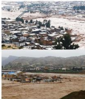
شکل (۵). وضعیت ساختمان ها در حریم رودخانه کشکان در پلدختر هنگام وقوع سیل