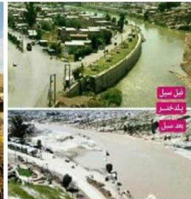
شکل (۳). رودخانه کشکان در پلدختر قبل و بعد از سیل

جهت تجزیه و تحلیل اطلاعات در این پژوهش نخست با استفاده از اطلاعات و شناخت به دست آمده از بازدیدهای میدانی و پیمایشی، عکس های وضع موجود و عکس های قدیمی سایت، نقشه های هوایی وضع موجود و سال های قبل، مطالعات و پژوهش های صوری گرفته در محدوده سایت و اسناد فرا دست، به بررسی و تحلیل اطلاعات کلی مربوط به محدوده مورد مطالعه پرداخته شده است. و در مرحله بعد با توجه به شاخصه های اصلی پژوهش پرسشنامه ی محقق ساخته، تنظیم شده است. که با استفاده از اطلاعات به دست آمده از پرسشنامه و به کمک برنامه SPSS به بررسی و تحلیل حوزه های اجتماعی و مربوط به مؤلفه عملکردی پژوهش، پرداخته و اطلاعات مربوط به این حوزه ها در قالب جداول و نمودار مورد بررسی و تحلیل قرار گرفته اند.