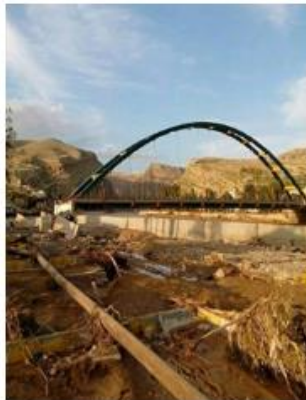
شکل (۴). رودخانه کشکان در پلدختر بعد از سیل