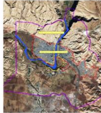
شکل (۱). محدوده شهرستان پلدختر