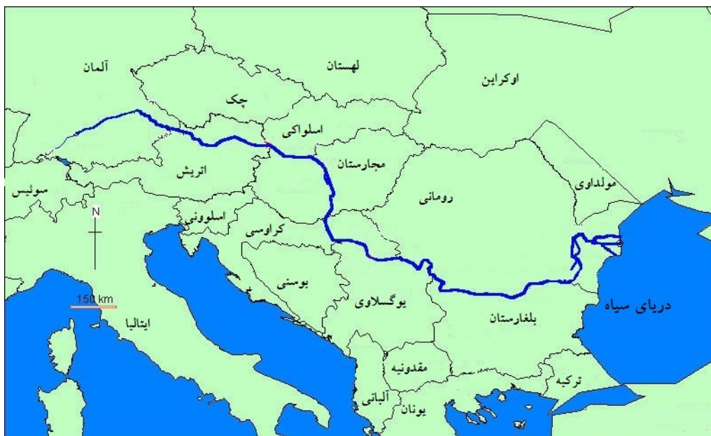
شکل (۲). موقعیت رودخانه دانوب در قاره اروپا

است (ووکویچ، ۲۰۱۴: ۳۲۵). از سویی بهبود وضعیت کانال کشتیرانی دانوب که امروزه به وسیله کانال به «ماین» و از آنجا به «راین» می‌پیوندد به این رود اجازه می‌دهد که به شاهراف کشتیرانی مهمی تبدیل شود که دریای شمال را به دریای سیاه متصل می‌کند (محمدعلی پور، ۱۳۹۴: ۱). شکل (۲).