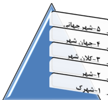
شکل (۱). انواع و مراحل تکامل شهر،