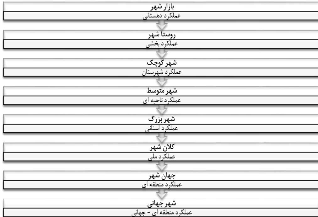
شکل (۲). انواع شهر از نظر اندازه و عملکرد فضایی

جغرافیدانان، شهر را محل تمرکز جمعیت، ابزار تولید، سرمایه، نیازها و احتیاجات و غیره می دانند که تقسیم کار اجتماعی نیز در آنجا صورت گرفته است و شهر را منظره‌ای مصنوعی از خیابانها، ساختمانها، دستگاهها و بناهایی می دانند که زندگی را امکان پذیر می سازد. بنابراین، شهر ترکیبی از عناصر مادی (مدنیت) و غیر مادی (اخلاقی) است که بخش دوم مهمتر است. (ربانی، ۱۳۸۷: ۱-۳).