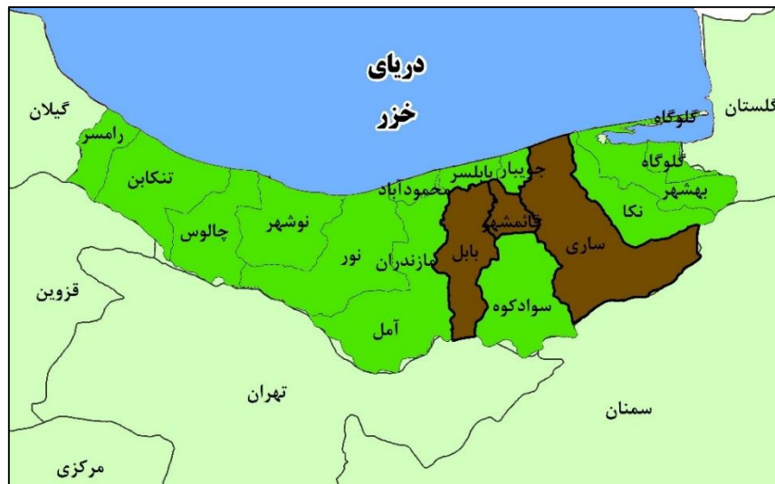
شکل (۱). موقعیت محدوده مورد مطالعه