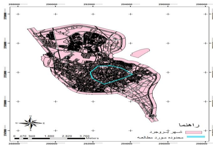
شکل (۱) نقشه موقعیت مکانی محدوده مورد مطالعه

قابل باز سازی است. ساختار کالبدی شهر بروجرد در دوران قبل از قاجار، شعاعی بوده و برمبنای مرکزیت بازار بوده است که عناصر اصلی آن شامل چهار محله صوفیان، دودانگه، رازان قدقون و یخچال، بازار و مسجد جامع، گذرهای اصلی منتهی به راه های کاروان رو و قلعه قدیمی شهر بوده است. بخش مرکزی شهر بروجرد: محدوده ای با وسعت 271/8 هکتار است که در مرکز جغرافیای شهر بروجرد واقع و با توجه به وسعت محدوده قانونی شهر بروجرد ( 2783 هکتار) 10 درصد از شهر را به خود اختصاص داده است. شکل (۱). و در سال 1385 دارای جمعیت برابر با 36726 نفر، به لحاظ موقعیت نسبی، این محدوده توسط خیابان های فروردین، صامت بروجردی و 35 متری طالقانی از شمال و شمال شرقی خیابان های امام حسین، سپاه و امام خمینی از جنوب شرقی و جنوب خیابانهای خرم (فردوسی) و امام خمینی از غرب و جنوب غرب و خیابان های کاشانی (گل سرخی) و بهار از غرب محدود شده است. اولین طرح شهری جهت هدایت و گسترش فیزیکی شهر طرح جامع بوده است که توسط مهندسین مشاور در فاصله سالهای 1356 ، 1360 تهیه شده است ( مهندسین مشاور طرح کاوش ، 1373 ).