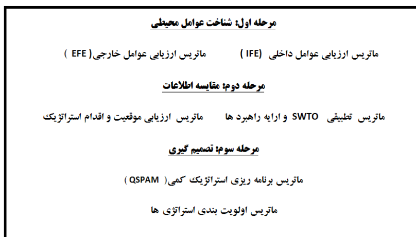
شکل (۱). روش شناسی و چهارچوب تحلیلی برنامه ریزی استراتژیک

این پژوهش با استفاده از روش شناسی توصیفی و تحلیلی و از طریق مطالعات اسنادی و میدانی انجام پذیرفته است. همچنین در پژوهش حاضر روش جمع آوری اطلاعات اسنادی بصورت مراجعه و فیش برداری از مدارک و اسناد کتابخانه‌ای و همچنین در مطالعات میدانی از روش نمونه برداری (روش کوکران)، مشاهده مستقیم، مصاحبه، تهیه عکس، فیلم و برای تجزیه و تحلیل اطلاعات از تکنیک استراتژیک SWOT و نرم افزارهای SPSS و EXCEL استفاده شده است. جامعه آماری مورد مطالعه در این مقاله را خبرگان و مسئولان دستگاهها و نهادهای مرتبط با گردشگری شهری تشکیل می دهند که تعداد ۷۰ نفر بعنوان نمونه انتخاب شده است. سپس باتوجه به تحلیل عوامل چهارگانه قوت، ضعف، تهدیدات و فرصت ها، پرسشنامه ای حاوی ۲۰ پرسش پنج گزینه ای به دست آمد در این بخش برای تکمیل پرسشنامه ها از ۷۰ نفر از خبرگان و مسئولان دستگاهها و نهادهای مرتبط با گردشگری شهر مورد مطالعه کسب نظر انجام شد. پرسش ها بر اساس طیف لیکرت شامل ۵ گزینه خیلی زیاد - زیاد - متوسط - کم و خیلی کم بود. جهت تجزیه و تحلیل اطلاعات و ارائه الگوی راهبردی توسعه توریسم شهری از روش تحلیلی SWOT استفاده شده است که در ابتدا با سنجش محیط داخلی و محیط خارجی شهر فهرستی از نقاط قوت، ضعف، فرصتها و تهدیدات مورد شناسایی قرار گرفت و سپس بوسیله نظر خواهی از خبرگان و مسئولان امر و وزن دهی به هرکدام از این مسائل و سپس محاسبه و تحلیل آنها، اولویت ها مشخص شد و جهت برطرف نمودن یا تقلیل نقاط ضعف و تهدیدها و تقویت و بهبود نقاط قوت و فرصتهای موجود در ارتباط با گسترش گردشگری شهری در شهر شهرکرد، در نهایت استراتژی های مناسبی ارائه شده است. مراحل شناسایی، ارزیابی و وزن دهی به عوامل چهارگانه در تحلیل SWOT عبارتند از شکل (۱):