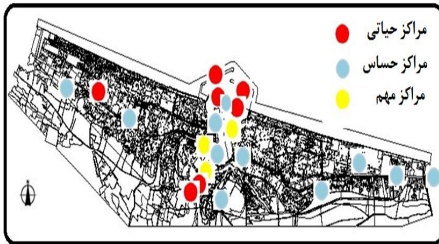
شکل (۳) نحوه پراکنش مراکز ثقل شهر بر اساس روش جدول ارزیابی

پس از تعیین مراکز استراتژیک توزیع فضایی و پراکندگی جغرافیایی آنها مورد بررسی قرار گرفت تا بخش هایی از شهر که واجد بیشترین کاربری های استراتژیک و نیز آسیب پذیری بیشتری هستند شناسایی شوند. این اطلاعات به صورت نقشه در شکل ۳ قابل مشاهده است.