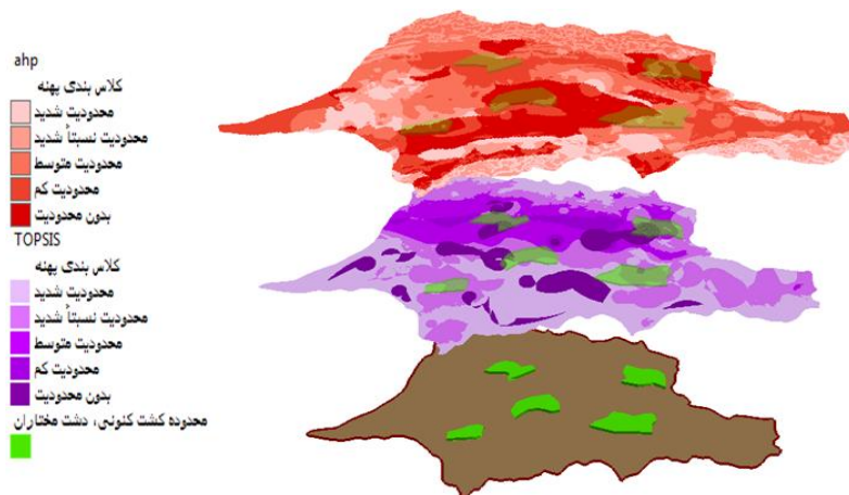
شکل (۴) ارائه نقشه‌های نهایی پژوهش در مدل

دشت مورد نظر در مرکز و متمایل به جنوب آن کشت می‌شود. سه پهنه دیگر این روش، یعنی با محدودیت متوسط، محدودیت نسبتاً شدید و محدودیت شدید، دقیقاً موقعیت‌های جغرافیایی را شامل می‌شوند که تقریباً مناطق تحت کشت کنونی پسته را شامل می‌گردد. بنابراین می‌توان گفت که هر چند دو نقشه به دست آمده از دو روش AHP و تاپسیس، در بعضی‌ها پهنه‌ها اشتراکات بسیار کوچکی را دارا می‌باشند، اما روش AHP با توجه به ویژگی‌های مختلفی که دارا است از جمله مراحل مختلف وزن‌دهی، محاسبه نرخ سازگاری وزن‌ها و هم چنین تطابق کشت کنونی با پهنه‌های مناسب استخراج شده از نقشه نهایی، روش مناسب‌تر برای پهنه‌بندی محصولاتی از این قبیل و از جمله پسته در منطقه مورد مطالعه می‌باشد.