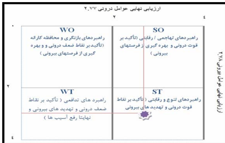
شکل (۲) ماتریس نمره نهایی ارزیابی عوامل داخلی و خارجی