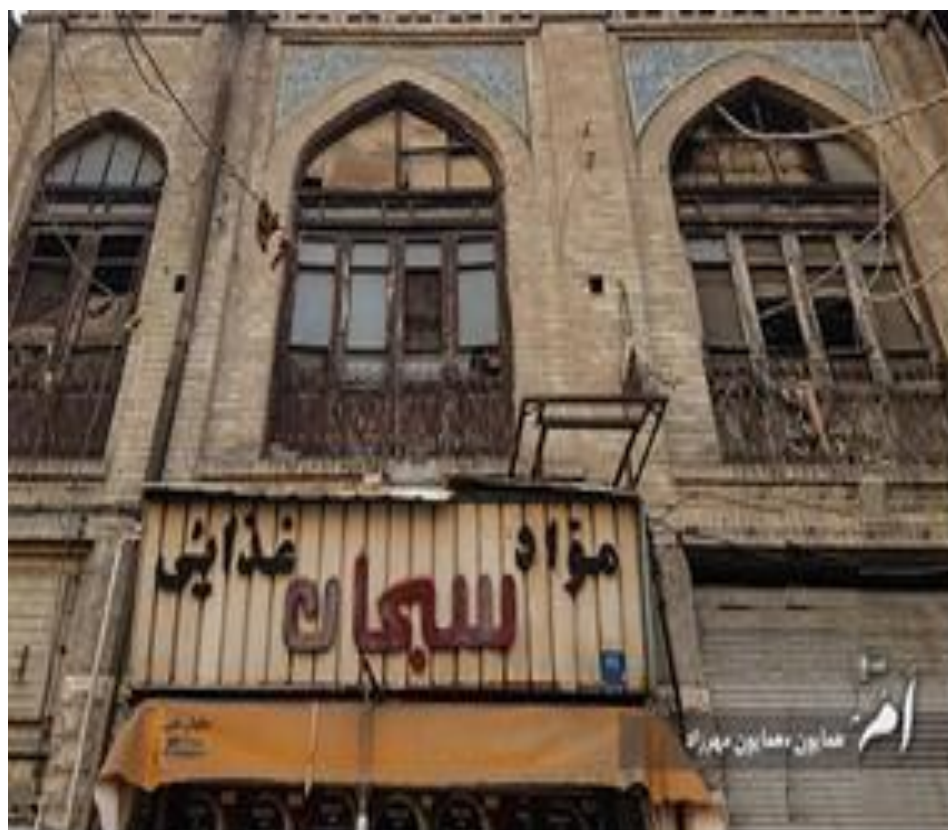
شکل (۳). نمونه‌هایی از اقدامات انسانی آسیب‌رسان در بافت تاریخی محله بهارستان