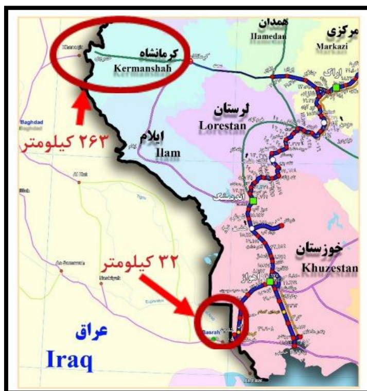
شکل ۶-مسیر ترانزیتی کرمانشاه _ بغداد

در عوض شلمچه_بصره، ایران می‌توانست راه آهن کرمانشاه_بغداد را از مسیر قصرشیرین-خانقین راه اندازد چراکه دسترسی به پایتخت در کشوری ازهم‌گسیخته امری است خردمندانه. همچنین، ایران می‌توانست با توسعه خط سنندج_سلیمانیه از مرز باشماق، دسترسی زمینی ایمن به بازار کردستان عراق داشته باشد شکل (۶).