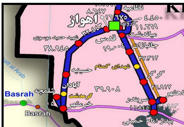
شکل (۵). مسیر ترانزیتی شلمچه_بصره

در عوض شلمچه_بصره، ایران می‌توانست راه آهن کرمانشاه_بغداد را از مسیر قصرشیرین-خانقین راه اندازد چراکه دسترسی به پایتخت در کشوری ازهم‌گسیخته امری است خردمندانه. همچنین، ایران می‌توانست با توسعه خط سنندج_سلیمانیه از مرز باشماق، دسترسی زمینی ایمن به بازار کردستان عراق داشته باشد شکل (۶).