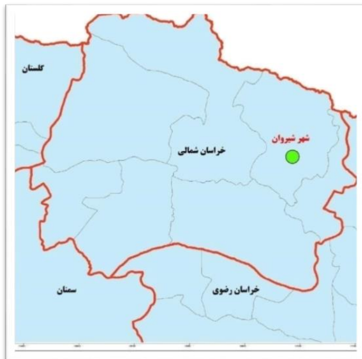
شکل (۱). موقعیت محدوده مورد مطالعه