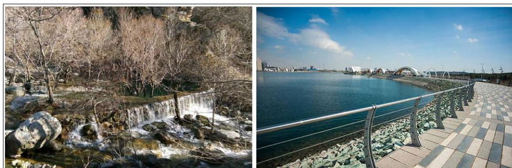
شکل (۴). جاذبه‌های شهر تهران (سمت راست: تصویر دریاچه چیتگر؛ سمت چپ: تصویر درکه)