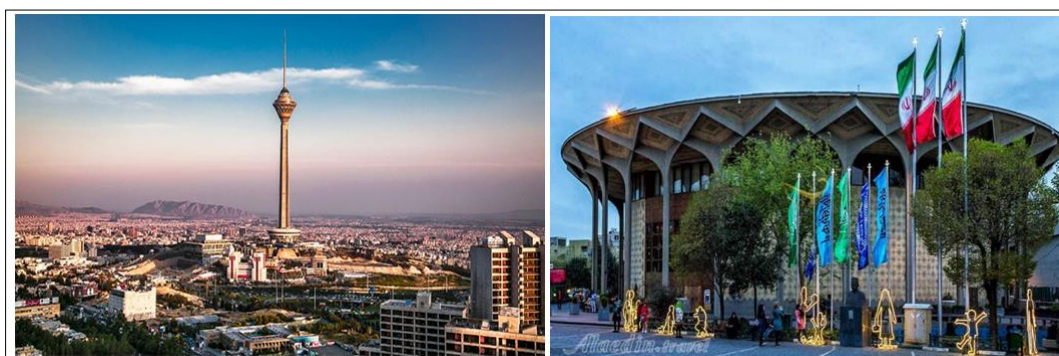
شکل (۳). جاذبه‌های شهر تهران (سمت راست: تصویر تئاتر شهر؛ سمت چپ: تصویر برج میلاد)