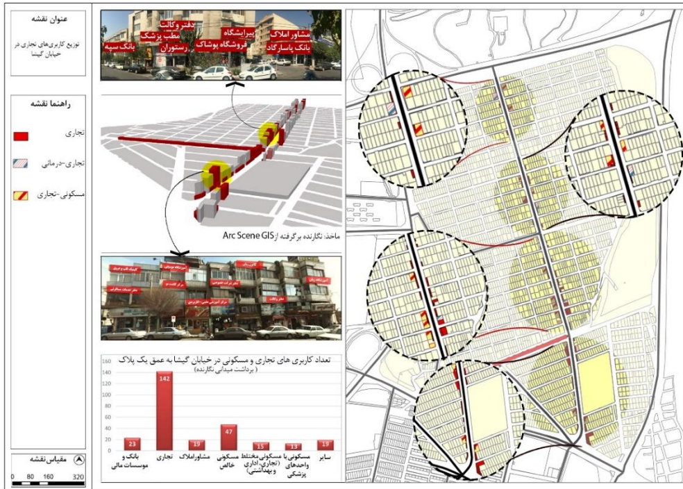
شکل (۳). نقشه توزیع و پراکندگی کاربری‌های تجاری در خیابان گیشا

به اندازه‌ای باشد که حضور ۲۳ بانک را توجیه کند. به منظور مشخص تر شدن وضعیت حضور بانک‌ها و مشاورین املاک در این خیابان، شکل (۵) در تشریح عامل دسترسی به مراکز مهم فعالیت اقتصادی ترسیم شده است.