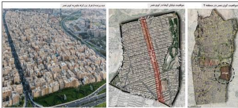
شکل (۱). نقشه معرفی محدوده خیابان گیشا

ساختار اصلی منظم و شطرنجی محله کوی نصر واقع در منطقه دو شهرداری تهران بر اساس خیابان گیشا شکل گرفته و غالب کاربری‌های تجاری محلی و فرامحلی در حاشیه این خیابان مکان یافته‌اند. خصلت تجاری غالب در این محور ۱۶۰۰ متری باعث شده که حضور مردم با فراغت و تفریح نیز همراه باشد و از این لحاظ خیابان گیشا نقشی فرامحله‌ای یابد. وجود کاربری‌های جاذب سفر در سطح منطقه و فرامنطقه (مجموعه برج میلاد، بوستان گفتگو، محل دائمی نمایشگاه‌های بین‌المللی شهرداری تهران و مرکز خرید گیشا) در نزدیکی این خیابان، سبب تمایز ساختار کالبدی و عملکردی آن شده است (آزادی و دیگران؛ ۱۳۹۶). شکل (۱) موقعیت خیابان گیشا را نشان می‌دهد.