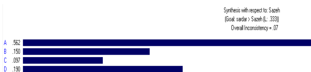
شکل (۳). اولویت‌بندی ویژگی‌های کالبدی سردر بناها (زیرمعیارها) دوره پهلوی در شهر زاهدان

اولویت‌بندی ویژگی‌های تزئینی سردر بناهای دوره پهلوی در شهر زاهدان (زیرمعیارها) اولویت‌بندی ویژگی‌های تزئینی سردر بناهای دوره پهلوی در شهر زاهدان نیز بررسی شد. در این زمینه نیز چهار ویژگی مورد تأکید بوده است که شامل کتیبه آجری ساده، تزئینات (ساده، جناغی، پیچ ماری و رگ چین)، تاجدار ساده با طاق گرد و جناغی و آجرکاری ساده با چین افقی است. تحلیل دیدگاه کارشناسان نشان می‌دهد که ویژگی استفاده از تزئینات ساده، جناغی، پیچ ماری و رگ چین با وزن ۰/۳۷۶ به‌عنوان مهم‌ترین ویژگی یا شاخص تزئینی سردر بناها شناخته شده است. در حقیقت این ویژگی، سردر بناهای دوره پهلوی در شهر زاهدان را متمایز می‌نماید. همچنین استفاده از کتیبه‌های آجری ساده نیز با وزن ۰/۲۴۱ در رتبه دوم اهمیت قرار گرفته است که در بیشتر بناها و سردر بناها قابل‌مشاهده است و نقش مهمی را در تزئینات سردرها ایفا می‌کند. تاجدار بودن ساده با طاق گرد و جناغی با وزن ۰/۲۳۱ در رتبه سوم و آجرکاری ساده با چین افقی نیز با وزن ۰/۱۵۲ در رتبه چهارم این اولویت‌بندی و اهمیت قرار گرفته‌اند؛ بنابراین استفاده از آجر، تاجدار بودن، استفاده از طاق‌های گر و جناغی و همچنین تزئینات غالب با آجر و به‌صورت ساده، غالب ویژگی‌های تزئینی سردر بناهای دوره پهلوی در شهر زاهدان محسوب می‌شود. جدول (۶) و شکل (۴) اولویت‌بندی ویژگی‌های تزئینی سردر بناها (زیرمعیار) دوره پهلوی در شهر زاهدان را با روش AHP نشان می‌دهد.