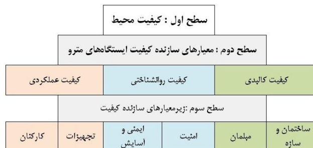
شکل (۲). مدل تجربی کیفیت محیطی ایستگاه‌های مترو

جهت دستیابی به اطلاعات ابتدا اسناد و مدارک، آمار و اطلاعات، متون فارسی، لاتین و ... از طریق مراجعه به کتابخانه، استفاده از نشریات تخصصی، منابع اینترنتی گردآوری شد. مدل تجربی سنجش کیفیت محیط دارای ساختاری سلسله‌مراتبی بوده و متشکل از معیارها و جزمعیارهایی است که در سطوح مختلف آن قرار می‌گیرند. در این جزمعیارهای سطح آخر مدل، مبنای تنظیم پرسشنامه تحقیق قرار گرفته و براساس میزان رضایتمندی یا نارضایتی ساکنین محیط موردنظر امتیازدهی می‌شوند. معیارهای اصلی جهت سنجش در سه دسته شامل معیارهای کالبدی و عملکردی و روان‌شناختی قرار گرفته که سطح دوم از معیارها را تشکیل می‌دهند. معیارها با استفاده از میزان رضایتمندی افراد و با استفاده از مدل‌های تحقیقات مشابه به‌دست آمده‌اند.