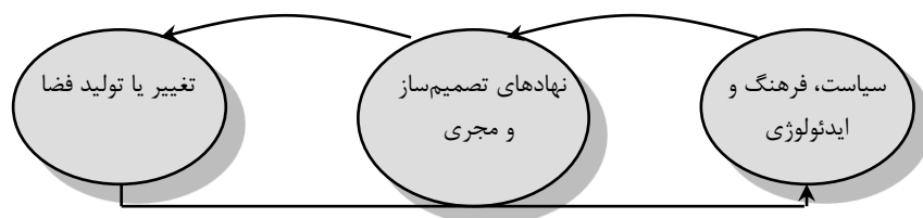
شکل (۱). رابطه سیاست و ایدئولوژی با تغییرات فضایی

در این راستا عناصر و محتوی فضای جغرافیایی در انضمام با نحوه تخصیص منابع و تبیین و چگونگی سیاست‌گذاری آن از سوی قدرت اجتماعی-سیاسی حاکم صورت می‌گیرد. در این راستا جغرافیدانان نسبت‌گرا متأثر از شناخت واقعیت‌های عملکرد سیاست و ایدئولوژی تبیین‌های استقرایی و جزئی را نافع تجویزات و غایت مطالعات اجتماعی ندانسته و در تحلیل فضایی به نقش قدرت در قالب اشکالی همچون گفتمان، ایدئولوژی و اقتصاد سیاسی توجه ویژه‌ای می‌نمایند. در این نگاه پرسش از چیستی گفتمان و سیاست پرسش از مجموعه‌ای از روابط درهم‌تنیده‌ای است که در کار شکل دادن به مناسباتی مرتبط با معنا بخشیدن و شکل دادن به فضای جغرافیایی می‌باشند. در چارچوب امر سیاسی ایدئولوژی، اقتصاد سیاسی و روابط اجتماعی به مدخلی برای شناخت فرم‌ها و فرایندهای فضایی در نظر گرفته می‌شود (تراکمه، ۱۳۹۳: ۲۶)؛ بنابراین هر چند هدف علوم جغرافیایی سازمان‌دهی فضایی در مقیاس‌های مختلف محلی، منطقه‌ای و ملی است. لیکن این سازمان‌دهی بدون لحاظ نمودن اثر هرکدام از سیاست‌های فضایی در ایجاد پراکندگی‌ها و افتراقات مکانی-فضایی ناکامل خواهد بود و فضا محصول نزاع میان «اتوریت‌های رقیب» بر سر دستیابی جهت سازمان‌دهی، اشغال و مدیریت می‌باشد.