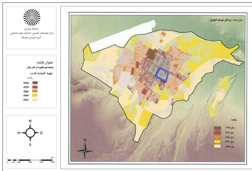
شکل (۳). توسعه فیزیکی شهر بجنورد ۱۳۲۵-۱۳۸۶