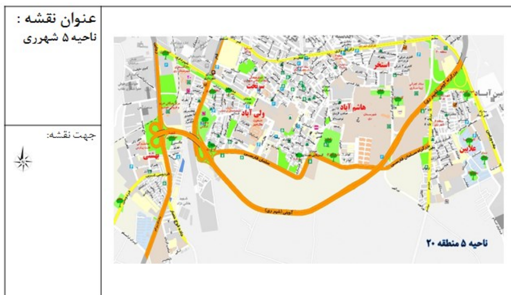
شکل (۲). منطقه مورد مطالعه، شهرداری منطقه ۲۰، ناحیه ۵ شهری

منطقه ۲۰ (شهری) جنوبی ترین منطقه شهری شهرداری تهران است. شهری محدوده ای است با مساحت ۲۲۹۳ کیلومتر مربع و با ۴۵۳۷۴۰ نفر جمعیت که از شمال به شهرستان تهران - از جنوب به شهرستان قم - از شرق به شهرستان ورامین و شهرستان پاکدشت و از غرب به شهرستان های اسلامشهر و رباط کریم محدود می شود. شهری در جنوب شرقی تهران و متصل به این شهر است. منطقه ی ۲۰ در حال حاضر دارای ۵ ناحیه خدمات رسانی شهرداری می باشد. (طرح تفصیلی منطقه ۲۰). از لحاظ تقسیمات شهرداری منطقه ۲۰ شهر تهران به ۷ ناحیه شهرداری و ۲۲ محله شهری تقسیم می شود. قلمرو مکانی پژوهش ناحیه ی ۵ شهری می باشد که از شمال به خیابان ۲۴ متری و سپاهیان انقلاب - از شرق به جنوب کمربندی ۴۵ متری و از غرب به خیابان قم و خط آهن تهران - مشهد محدود می شود. جمعیت این ناحیه ۵۱۵۹۹ نفر و مساحت آن ۸۱.۵ کیلومتر مربع می باشد. تعداد خانوار این ناحیه ۱۷۹۵۵ خانواده است. شکل (۲).