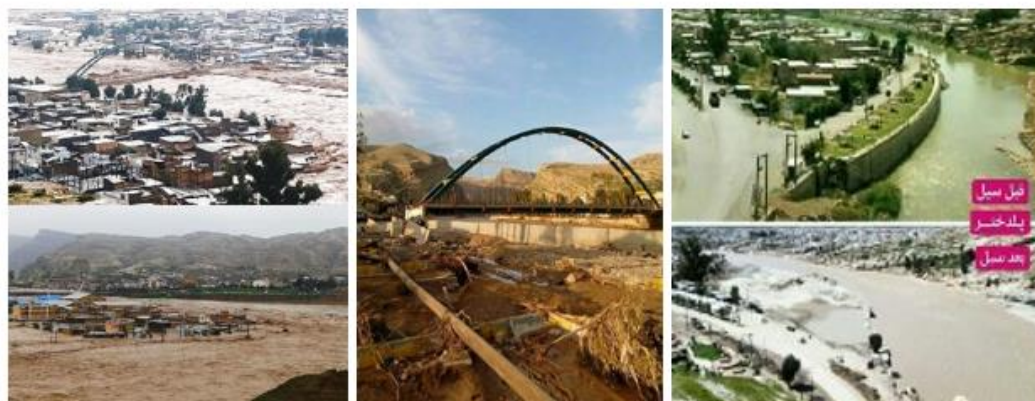
شکل (۳). رودخانه کشکان در پلدختر قبل و بعد از سیل