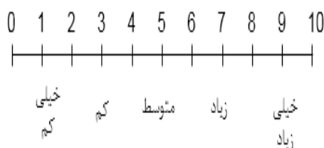
شکل (۴). مقیاس دوقطبی فاصله‌ای

پس از روشن شدن میزان اهمیت معیارها و شاخص‌ها، می‌باید امتیاز آن‌ها مشخص شود. برای تعیین امتیاز، از اطلاعات مربوط به جداول مقایسه وضع موجود منطقه (حین اجرا طرح) و طرح موردنظر استفاده شد. این اطلاعات حاصل تجزیه و تحلیل وضع موجود در منطقه و طرح CDS است که پیش‌از این بدان اشاره شد. به این صورت که پس از دریافت نظرات در قالب مصاحبه آزاد، امتیازدهی به معیارها انجام شد. برای اندازه‌گیری امتیاز اثرات مثبت و عوامل منفی بر هر شاخص و در نهایت معیار، از مقیاس دوقطبی فاصله‌ای استفاده شد. این اندازه‌گیری بر اساس یک مقیاس ۱۰ نقطه‌ای است که در آن صفر مشخص‌کننده حداقل ارزش ممکن و ۱۰ مشخص‌کننده حداکثر ارزش ممکن از اثرات عوامل مثبت بر معیارهای موردنظر است. در این مقیاس، نقطه وسط (۵) نقطه شکست مقیاس بین مطلوب و نامطلوب است، ضمناً از مقادیر ۲، ۴، ۶، و ۸ می‌توان در هنگامی استفاده کرد که حالت‌های میانه وجود دارد (زبردست و همکاران، ۱۳۹۲).