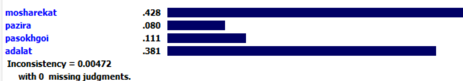
شکل (۳). ضرائب اهمیت معیارها

پس از روشن شدن میزان اهمیت معیارها و شاخص‌ها، می‌باید امتیاز آن‌ها مشخص شود. برای تعیین امتیاز، از اطلاعات مربوط به جداول مقایسه وضع موجود منطقه (حین اجرا طرح) و طرح موردنظر استفاده شد. این اطلاعات حاصل تجزیه و تحلیل وضع موجود در منطقه و طرح CDS است که پیش‌از این بدان اشاره شد. به این صورت که پس از دریافت نظرات در قالب مصاحبه آزاد، امتیازدهی به معیارها انجام شد. برای اندازه‌گیری امتیاز اثرات مثبت و عوامل منفی بر هر شاخص و در نهایت معیار، از مقیاس دوقطبی فاصله‌ای استفاده شد. این اندازه‌گیری بر اساس یک مقیاس ۱۰ نقطه‌ای است که در آن صفر مشخص‌کننده حداقل ارزش ممکن و ۱۰ مشخص‌کننده حداکثر ارزش ممکن از اثرات عوامل مثبت بر معیارهای موردنظر است. در این مقیاس، نقطه وسط (۵) نقطه شکست مقیاس بین مطلوب و نامطلوب است، ضمناً از مقادیر ۲، ۴، ۶، و ۸ می‌توان در هنگامی استفاده کرد که حالت‌های میانه وجود دارد (زبردست و همکاران، ۱۳۹۲).