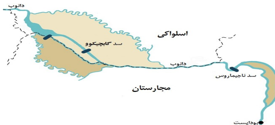
شکل (۳). موقعیت سد‌های گابچیکوو-ناگیماروس بر روی رودخانه دانوب

اسلواک‌ها مسیر دانوب را از طریق یک کانال به نیروگاه "گابچیکوو" منحرف کردند. اقدامی که موجب شد بستر اصلی دانوب در خاک مجارستان یک‌باره ۹۰ تا ۹۵ درصد از آب خود را از دست بدهد. به‌طوری که تیرک‌های شاخص سطح آب، در خشکی قرار گرفت و سطح سفره‌های آب زیرزمینی دو-سه متر افت کرد (مولدوا، ۱۳۸۴: ۲۶). مجارهای تندروها از انفجار سد سخن راندند که به احتمال قوی باعث جنگ می‌شد که در این میان اتحادیه اروپا پیشنهاد میانجی‌گری داد. بر پایه برآوردها منفعت اتحادیه اروپا برای مداخله در این قضیه در ثبات منطقه نهفته بود. اتحادیه اروپا که نگران تکرار وقایع بالکان در این منطقه بود و بیم این می‌رفت که با آغاز درگیری افزون بر دخالت قدرت‌های فرامنطقه‌ای، ناامنی به کل منطقه بگسترده، پیشنهاد میانجی‌گری داد. با این حال، ایده میانجی‌گری در آغاز توسط طرف مجارستانی پشتیبانی نشد. چرا که مجارستان مسئله میانجی‌گری را منوط به رد «نسخه c» طرف اسلواکی می‌کرد (ووکویچ، ۲۰۱۴: ۳۳۶). شکل (۳).