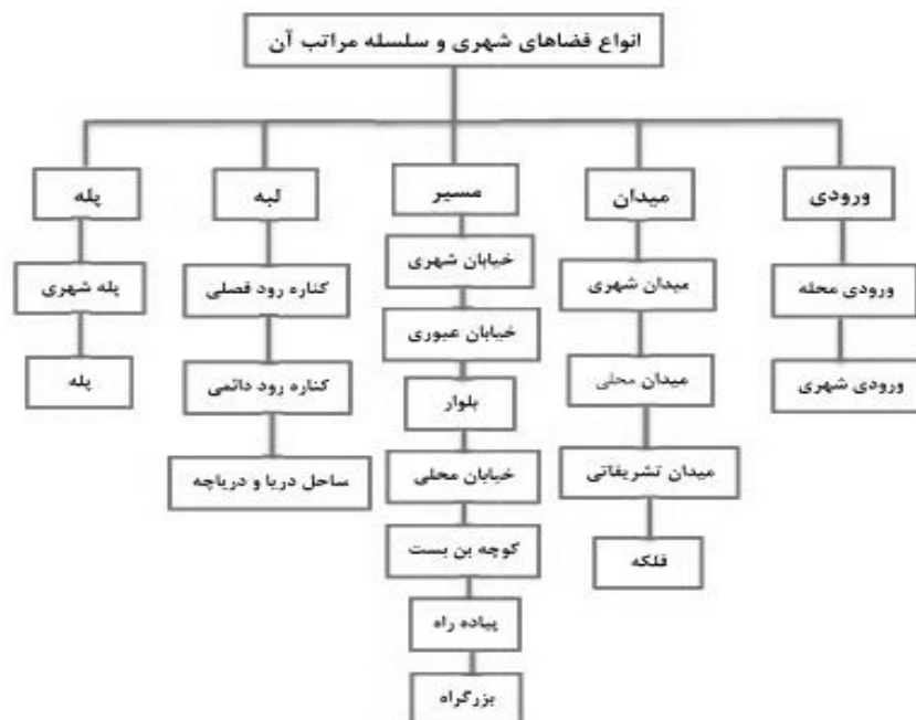
شکل (۱). انواع فضاهای شهری و سلسله مراتب آن