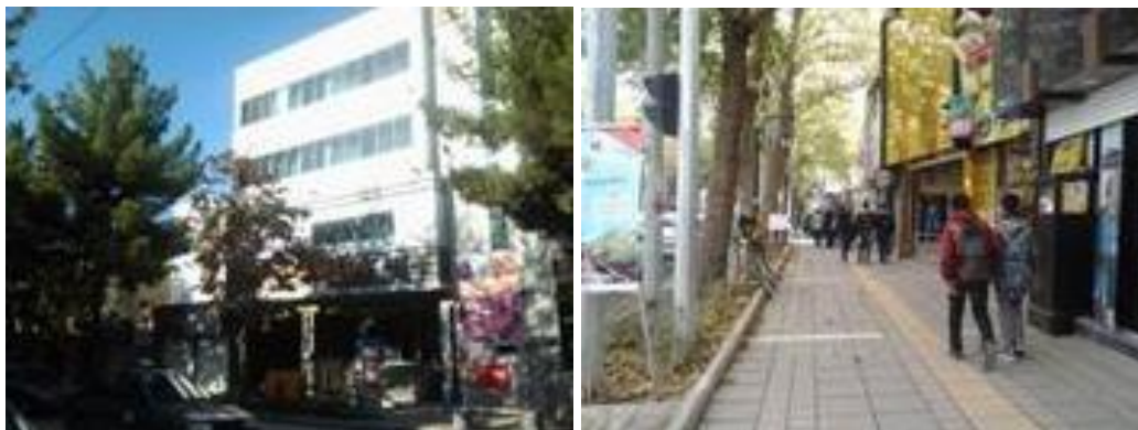
شکل (۳). تقسیم بنا به احجام متناسب با دانه بندی بخش تاریخی شهر

طرح و اجرای بناهای واقع در مناطق تاریخی شهر باید دارای مقیاس انسانی بوده و دانه بندی و ریخت شناسی مشابه بافت تاریخی شهر داشته باشد. در طراحی معماری بناهای کلان مقیاس، تقسیم بنا به احجام متناسب با دانه بندی بخش تاریخی شهر الزامی است.