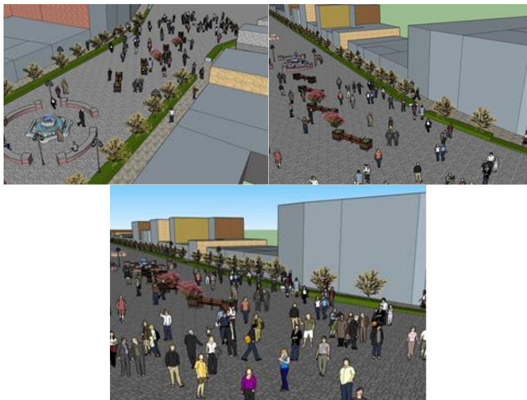
شکل (۷) طرح های پیشنهادی محدوده مورد مطالعه

شهری ونیز تصمیم مردم برای پیاده روی در یک مکان خاص اثر دارد را مشخص می نماید. انتخاب افراد برای پیاده روی و لذت از یک فضای شهری مانند پیاده راه می تواند بر اساس درک ذهنی آنها از فضا، یا ویژگی های محیطی فضای شهری صورت گیرد شکل (۷).