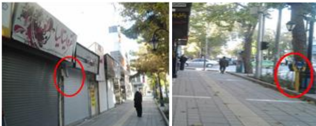
شکل (۵) مکان یابی کابین ها، کیوسکها در معابر پیاده

ایجاد هرگونه اختلاف سطح (لبه، پله، سکو و ...) در مسیر عبور در معابر پیاده ممنوع است و تغییرات سطوح بایستی بوسیله شیب راهه و رمپ انجام شود. شکل (۶).