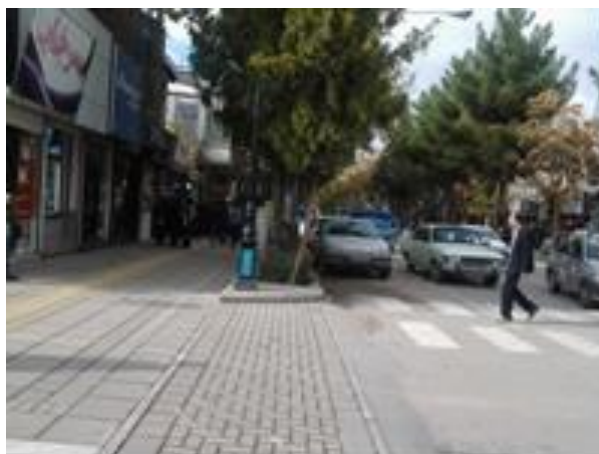
شکل (۶) اختلاف سطح (لبه، پله، سکو و ...) در مسیر عبور در معابر پیاده

ایجاد هرگونه اختلاف سطح (لبه، پله، سکو و ...) در مسیر عبور در معابر پیاده ممنوع است و تغییرات سطوح بایستی بوسیله شیب راهه و رمپ انجام شود. شکل (۶).