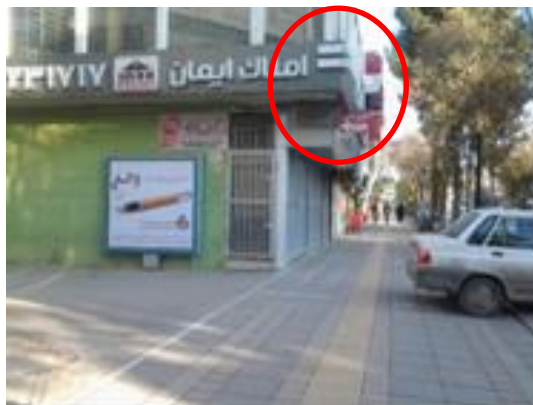
شکل (۴). پیش آمدگی بدنه ساختمان ها (نظیر بالکن، تراس و ...) در فضاهای شهری

برداری از این فضاها به عنوان انباری (محل نگهداری مواد غذایی، سوخت و ...) و خشک نمودن البسه ممنوع است. شکل (۳).