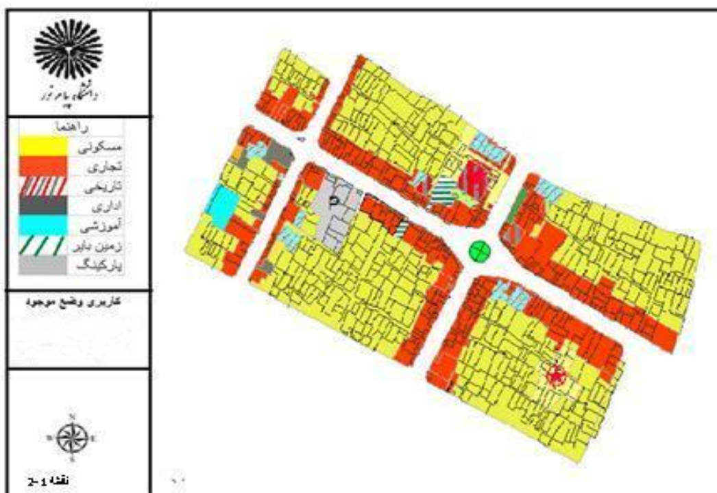
شکل (۱) بررسی کاربری‌های محدوده مورد مطالعه

ابتدا با استفاده از روش اسنادی و ابزاری همچون کتاب‌ها، مقالات، مجلات و ... به گردآوری اطلاعات مربوط به محدوده مورد مطالعه پرداخته و سپس با استفاده از روش غیر اسنادی (میدانی)، بازدید میدانی و تهیه عکس به تجزیه و تحلیل وضع موجود و ارائه راهکارهای مناسب پرداخته شد. سپس شاخص‌های کیفیت محیطی بررسی و تحلیل شده است، تا با تأکید بر ابعاد فرهنگی اجتماعی، به تأثیر پیاده راه بر تعاملات اجتماعی با استفاده از برداشت‌های میدانی و مصاحبه با ساکنان به جمع‌آوری داده‌ها پرداخته شده است.