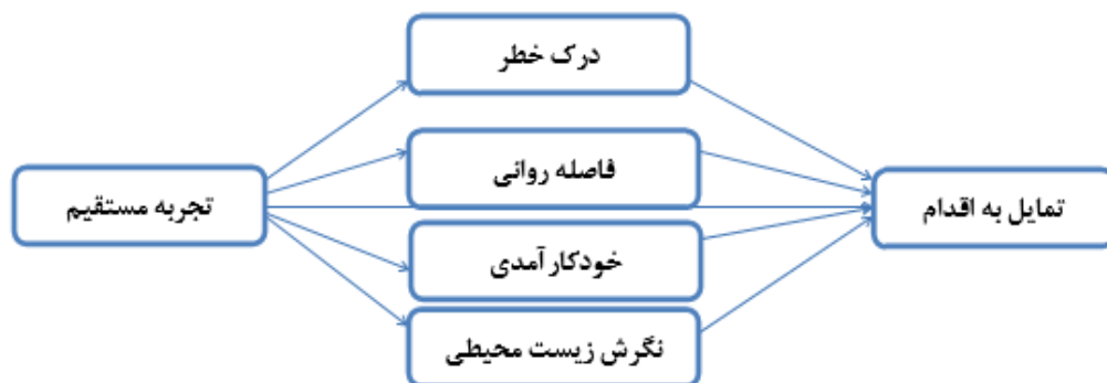
شکل (۱). الگوی علی تعیین روابط بین عوامل مؤثر بر تمایل به اقدام جهت کاهش تغییرات اقلیمی

زمانی در (ذهن) یک فرد در ارتباط است. این تئوری بین فاصله روانی درک شده با تفسیر ذهنی از حوادث رابطه برقرار می‌کند. از آنجا که نیت عمومی برای انجام یک رفتار مثلاً "من قصد دارم اقداماتی برای متوقف کردن گرمایش جهانی انجام دهم" منعکس کننده سطح بالاتری از انتزاع هستند و برای فرد بیشتر جنبه روانی دارند؛ هنگامی که در مورد گرمایش جهانی در سطح انتزاعی فکر می‌شود، افراد بر روی تصویری بزرگتر و ویژگی‌های اصلی این پدیده که یک نمای کلی از وضعیت را ارائه می‌دهد، متمرکز می‌گردند. اما در مقابل نیت در مورد اقدامات خاص مانند (من سعی دارم که کمتر از تهویه کننده‌های هوا در تابستان و گرم کننده‌های هوا در زمستان استفاده کنم) منجر می‌شود مردم بر روی جزئیات گرمایش جهانی تمرکز کنند، به گونه‌ای که تجربیات شخصی برجسته‌تر می‌گردد (برومل و همکاران، ۲۰۱۵؛ ۶۸). از این رو، انتظار می‌رود تجربه شخصی فاصله روانی را و همچنین فاصله روانی تمایل یا نیت افراد را در مورد اقدامات خاص جهت کاهش تغییرات اقلیمی تحت تأثیر قرار دهد. شکل (۱) الگوی علی پیشنهادی جهت تعیین روابط بین عوامل مؤثر بر تمایل به اقدام جهت کاهش تغییرات اقلیمی را نشان می‌دهد.