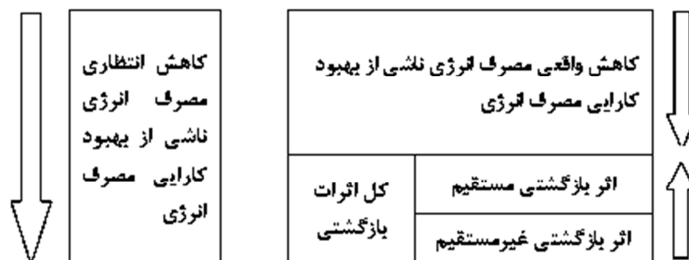
شکل (۱). تقسیم‌بندی اثرات بازگشتی