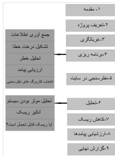
شکل ۳. فرآیند ارزیابی ریسک در سدها به روش RAM-D [۱۳]

روش RAM-D از روش تحلیل درخت خطا بهره می‌گیرد و اطلاعات مورد نیاز را از متخصصان، منابع موجود و سایت‌های اینترنتی فراهم می‌کند و طرح و نقشه اولیه سدها به شدت بستگی به این موارد دارد. RAM-D فرآیند زنده و پویا است که با تغییر محیط تهدید نیاز به بازبینی و تغییر دارد [۱۳]. در شکل ۳ مراحل اجرای ارزیابی ریسک به روش RAM-D نشان داده شده است.