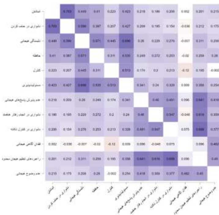
جدول ۲. شاخص‌های همسانی درونی پرسشنامه انباشت بی‌رویه داده‌های دیجیتالی و زیرمقیاس‌های آن