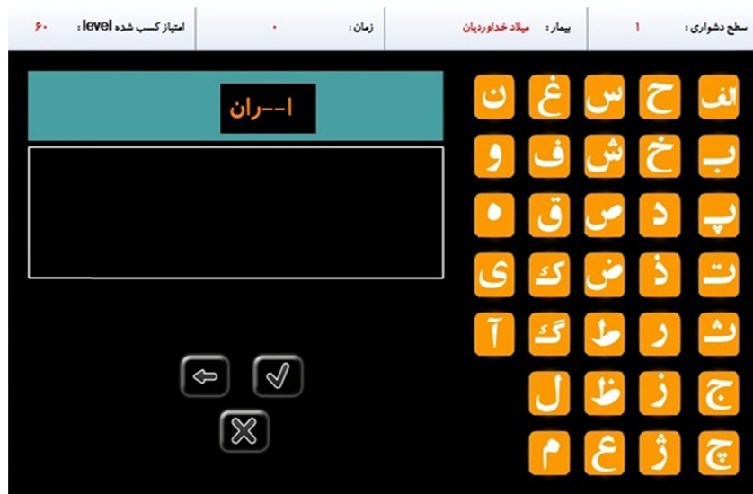
تصویر ۱- نمونه‌ای از تمرینات جهت تقویت حافظه آینده‌نگر

سطح (ب) عدم تشویق حدس زدن و استفاده از روش آزمایش و خطا (ج) ندادن فرصت اشتباه به فرد با دادن سرخ‌های بیشتر برای بازیابی تا رسیدن به پاسخ درست (د) ارائه نمونه و مثال‌های کافی قبل از اینکه از فرد خواسته شود تکلیف اصلی را انجام دهد (و) تصحیح فوری خطاها.