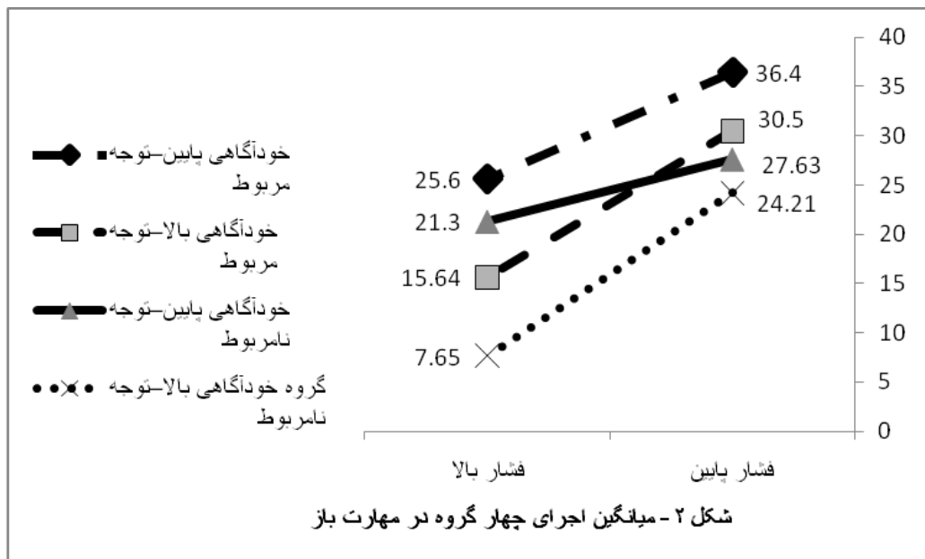
شکل ۲- میانگین اجرای چهار گروه در مهارت باز

شرایط فشار بالا جهت تمرکز توجه از علائم مربوط به تکلیف به علائم نامربوط به تکلیف، تغییر می‌کند. برای تکالیفی که نیازی به توجه کافی ندارند، حواسپرتی تحت شرایط فشار بالا می‌تواند انسداد را تسکین دهد (بامیستر، ۱۹۸۴؛ بیلک و همکاران، ۲۰۰۱؛ سدرتی، ۲۰۰۷؛ لند، ۲۰۰۷).