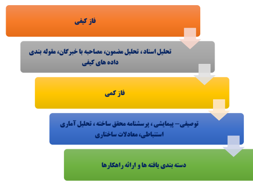
شکل (۱) مراحل روش‌شناسی پژوهش