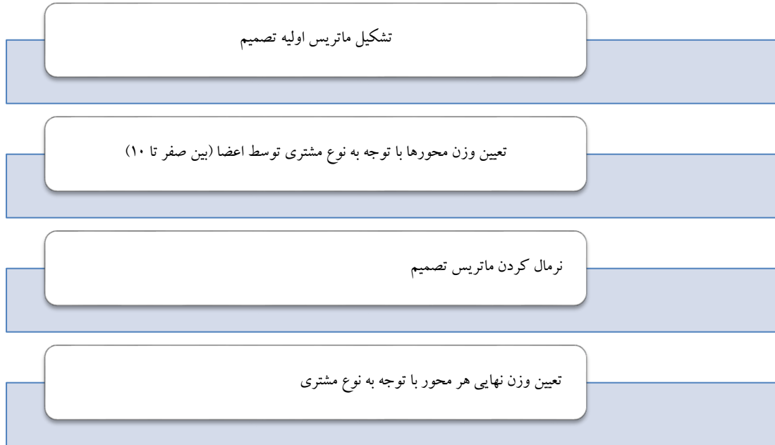
شکل ۱- مراحل تعیین وزن محورها با توجه به نوع مشتری

آن نوع مشتری ( G ، B و C ) قرار داشتند و هریک از آنها می‌بایست اهمیت سه محور را در مقابل این سه نوع مشتری تعیین نماید و برای نرمال کردن آن وزن هریک تقسیم بر مجموع اهمیت‌های نوع مشتری شد که در نهایت مجموع وزنی آن‌ها یک می‌شود. بدین صورت از نگاه هریک از