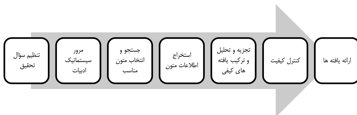
شکل ۱. هفت گام فراترکیب (سندلوسکی و باروسو، ۲۰۰۷)

در مرحله‌ی اول یعنی گردآوری داده‌های کیفی پژوهش که هدف آن تدوین الگو است از روش فراترکیب استفاده نمود. به منظور تحقق هدف تحقیق، از روش هفت مرحله‌ای سندلوسکی و باروسو ۱ (۲۰۰۷) استفاده شد. در مرحله‌ی دوم، به صحنه‌گذاری و اعتبارسنجی الگو ارائه شده با استفاده از نظر خبرگان کسب و کارهای اینترنتی شامل مدیران و کارشناسان خبره در حوزه‌ی شبکه‌های اجتماعی در شرکت‌ها و در بخش ارتباط با مشتریان،