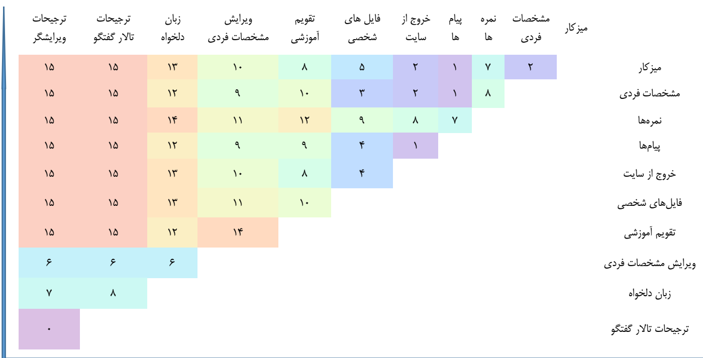
نمودار ۱. بخشی از نمودار ماتریس فاصله کارت‌ها

و همچنین در ادامه، قسمتی از یافته‌های ماتریس فاصله نشان داده شده است، اعداد نمودار نشانگر اختلاف بین کارت‌ها در هر جفت است. هرچه عدد پایین‌تر باشد، دو کارت شباهت بیشتری دارند و هرچه تعداد آن بیشتر باشد، مقادیر متفاوت‌تر هستند، بنابراین همان گونه که مشاهده می‌شود به عنوان مثال «ترجیحات گفتگو» با «ترجیحات ویرایشگر» بیشترین شباهت را دارند و در عین حال «ترجیحات گفتگو» با «میزکار» بیشترین میزان تفاوت را از نظر شرکت‌کنندگان پژوهش داشته‌اند.