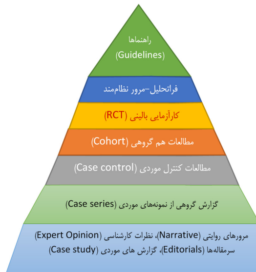
شکل ۱- هرم دانش بر اساس کیفیت آن (از منظر اثبات‌گرایی منطقی حوزه پزشکی). این هرم در سال ۱۹۷۹ توسط کارگروه آزمون‌های ادواری سلامت کانادا ترسیم شد (Burns, et al., 2011)

همانگونه که ذکر شد، هدف عمده ترجمه دانش، تولید و انتخاب دانش مؤثر، پل زدن بین تولیدکننده و مصرف‌کننده