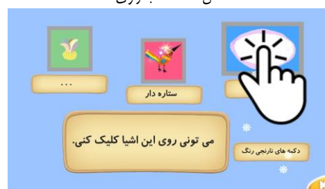
شکل ۱۱. آموزش نقاط هات اسپات

راهنماهای مناسب برای حرکت در صفحات کتاب در نظر گرفته شده است. در برخی از کتاب‌ها جورچینی از شخصیت‌ها یا صفحات کتاب برای بازی خواننده در نظر گرفته شده است. این جورچین در روند داستان تأثیری ندارد و فقط جنبه سرگرمی برای خواننده دارد و نمی‌توان آن را یک کتاب‌بازی در نظر گرفت.