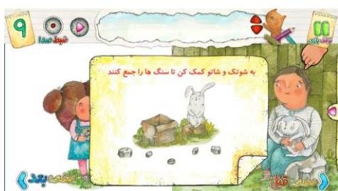
شکل ۹. نمونه تعامل در کتاب بگذار فکر کنم از مجموعه شوتک