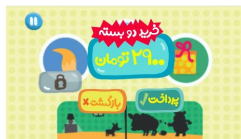
شکل ۲. پرداخت هزینه برای خرید بسته

چند بازی متناسب با داستان طراحی شده است. به عنوان نمونه: جورچین و وصل کردن اشیاء مشابه به هم. کودک برای انجام این بازی‌ها یا دیگر عکس‌العمل‌هایی که متناسب با صحبت راوی باید انجام دهد می‌تواند از ضربه زدن روی صفحه یا کشیدن استفاده کند.