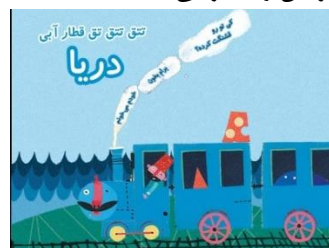
شکل ۵. صفحه اول کتاب قطار آبی: دریا استدیو بازی‌سازی یوزپا

در این مجموعه نیز برای شروع خواننده باید بتواند کلمات را بخواند (شکل ۵). مخاطب با ضربه‌زدن روی تصاویری که هات اسپات هستند (یا در مواردی کشیدن) آن‌ها را به حرکت می‌آورد یا ظاهرشان را تغییر می‌دهد