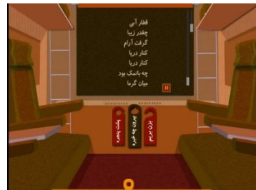
شکل ۴. صفحه اصلی کتاب قطار آبی: دریا

شعرها و تصاویر نسخه تعاملی و نسخه چاپی مجموعه قطار آبی یکی هستند اما کتاب برای نسخه تعاملی بازنویسی شده است. پرده پنجره در قطار هات اسپات است. با ضربه زدن روی آن پرده روی پنجره کشیده می‌شود و متن شعر روی آن ظاهر می‌شود. براساس انتخاب پیشین خواننده، این متن را یا راوی یا خودش خواهد خواند. سه هات اسپات دیگر نیز در نظر گرفته شده‌اند (شکل ۴): بزن بریم (با ضربه‌زدن روی آن قطار حرکت می‌کند)، بیرون چه خبره (متناسب با کتاب تصاویری متحرک از کوه، جنگل یا دریا نشان داده می‌شود. در این بخش جلوه‌های صوتی و هات اسپات‌های جدیدی در نظر گرفته شده است) و پشت پنجره (با انتخاب این مورد تصویری بزرگ‌نمایی شده از منظره پشت پنجره نمایش داده می‌شود).