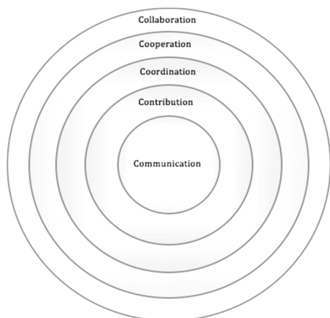
تصویر ۱- مدل مشارکت شاه (۲۰۱۰)

اغلب افراد درک متفاوتی از معنای واژه مشارکت دارند و به اشتباه از واژه‌هایی مانند هماهنگی ۹ و همکاری ۱۰ به جای آن استفاده می‌کنند. دنینگ ۱۱ (۲۰۰۸) کلمات هماهنگی و همکاری را از مشارکت ضعیف‌تر می‌داند. از طرف دیگر تیلور پاول ۱۲ (۱۹۹۸) معتقد است که ارتباطات ۱۳ ، کمک ۱۴ ، هماهنگی و همکاری گام‌های اصلی مشارکت هستند. به باور آن‌ها برای مشارکت واقعی افراد گروه بایستی از یکپارچگی قوی برخوردار بوده و در این گروه حرکت از ارتباطات ساده آغاز و به سطوح بالاتر یعنی هماهنگی، همکاری و مشارکت ختم می‌گردد. این ارتباط به‌خوبی در مدل مشارکت شاه ۱۵ (۲۰۱۰) (شکل ۱) نشان داده شده است.