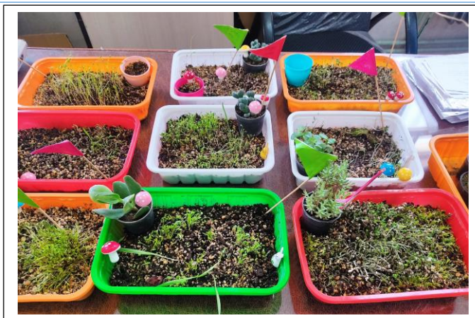
شکل ۱: گلخانه (محل قرار دادن گلدان سبزی‌ها)

هر جلسه از دو بخش تشکیل شده است. بخش اول مرتبط با آموزش و تمرین مهارت‌های مرتبط با توجه پایدار و بخش دوم مرتبط با چالش‌های فردی و گروهی است. در ابتدا مرور تمرینات جلسه قبل انجام می‌شود. سپس پژوهشگر درباره‌ی محتوای جلسه‌ی جدید آموزش‌های لازم را ارائه می‌دهد و دانش‌آموزان در گروه‌های خود به تمرین آن مهارت می‌پردازند. پس از تمرین فردی دانش‌آموزان فعالیت‌های جلسه را به صورت چالش گروهی انجام می‌دهند و با دیگر گروه‌ها رقابت می‌کنند و به کسب امتیاز می‌پردازند. با این شیوه دانش‌آموزان ترغیب می‌شوند تا با دوستانشان در اجرای مهارت‌ها تعامل کنند.