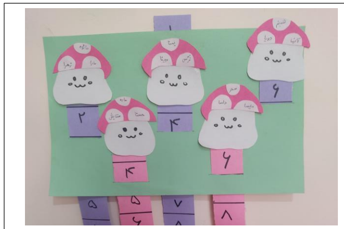
شکل ۳: تابلو امتیازات

تکالیف هر جلسه در انتهای کلاس ارائه می‌شود. کودک به تعداد دفعات فرصت کوشش و خطا دارد و به این منظور قبل از شروع جلسات، گروهی مجازی برای هر دو گروه کنترل و آزمایش تشکیل داده شد. در گروه مجازی آزمایش به تکالیف دانش‌آموزان بازخورد داده می‌شد، امتیازات آنان در اطلاع عموم قرار می‌گرفت و نفرات برتر هر جلسه در گروه معرفی می‌شدند. گروه مجازی تشکیل شده برای گروه کنترل تنها جهت اطلاع‌رسانی برنامه کلاسی و قرار دادن تکالیف کلاسی تشکیل شد و هیچ گونه برنامه‌ی بازی‌وارسازی شده‌ای در آن اجرا نگردید.