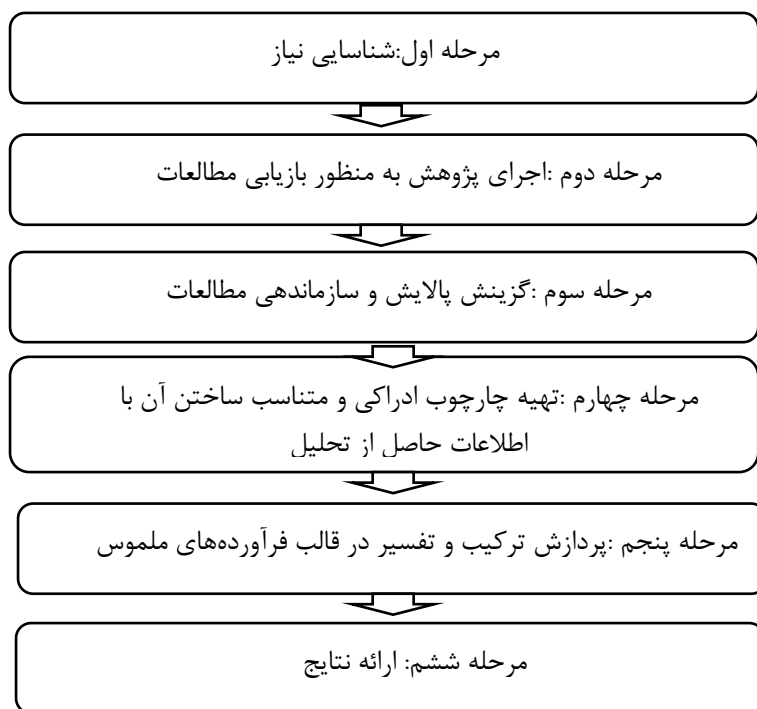
شکل ۱: الگوی شش مرحله ای رابرتس (مارش ۲ ، ۱۳۹۲)

سپس با استفاده از کاربردگر طراحی شده توسط پژوهشگران (پیوست الف)، اطلاعات هر کدام از ۲۴ سند مکتوب، ثبت شد. سپس با استفاده از الگوی شش مرحله-ای سنتز پژوهی رابرتس ۱ (شکل ۱) داده‌ها تحلیل شدند و ویژگی‌های برنامه درسی ریاضی دوره ابتدایی با رویکرد شناختی، استخراج گردید. آنگاه این ویژگی‌ها با ویژگی‌های تبیین شده در پژوهش زادشیر، عصاره، غلام‌آزاد و امام‌جمعه (۱۴۰۱) با هم مقابل شدند که نتیجه آن، طراحی اولیه الگویی برای برنامه درسی ریاضی دوره ابتدایی مبتنی بر رویکرد شناختی بود.