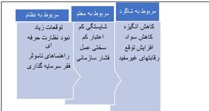
شکل ۲: طبقه‌بندی آسیب‌های ارزشیابی توصیفی دوره ابتدایی از نظر برنامه‌ریزان درسی

یافته‌ها: آسیب‌های ارزشیابی توصیفی در نظام آموزش ابتدایی ایران در گفتگوهای عمیق با متخصصان برنامه‌ریزی درسی آشکار شد که نظام ارزشیابی توصیفی دوره ابتدایی با دوازده آسیب عمده مواجه است. تلفیق نتایج نشان داد که آسیب‌های طرح ارزشیابی توصیفی دوره ابتدایی در سه طبقه قرار می‌گیرند: آسیب‌های مربوط به نظام آموزش و برنامه درسی، آسیب‌های مربوط به معلم و آسیب‌های مربوط به شاگردان (شکل ۲).