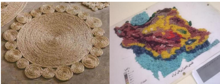
شکل ۸- تلفیق هنر نقاشی با هنر تجسمی: برجسته کاری (به کمک کف و کاموا)