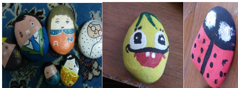
شکل ۴- تلفیق هنر نقاشی با هنرهای بصری تجسمی و تبدیل به شخصیت‌های داستانی