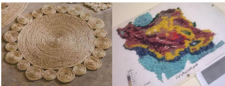
شکل ۸- تلفیق هنر نقاشی با هنر تجسمی: برجسته کاری (به کمک کف و کاموا)